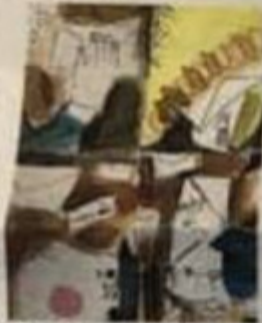
Obra da artista Mirta Caccaro, da Itália

Essas exposições com obras compartilhadas acontecem em todo o mundo e são chamadas de "Convocatória". Elas podem ou não ter um tema. O artista convida outros através de grupos na internet para participarem e recebem uma enxurrada de envelopes contendo verdadeiras