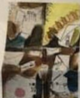
Obra da artista Mirta Caccaro, da Itália

Essas exposições com obras compartilhadas acontecem em todo o mundo e são chamadas de "Convocatória". Elas podem ou não ter um tema. O artista convida outros através de grupos na internet para participarem e recebem uma enxurrada de envelopes contendo verdadeiras