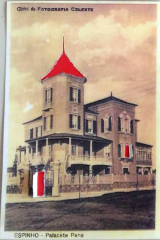
ESPINHO - Palacete Pena