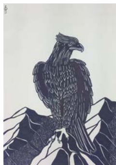
In copertina: R. Covili, L'aquila dominatrice 2015 inchiostro, cm 43,5 x 33,5

15 | Historia Plantarum di Silvia Panini