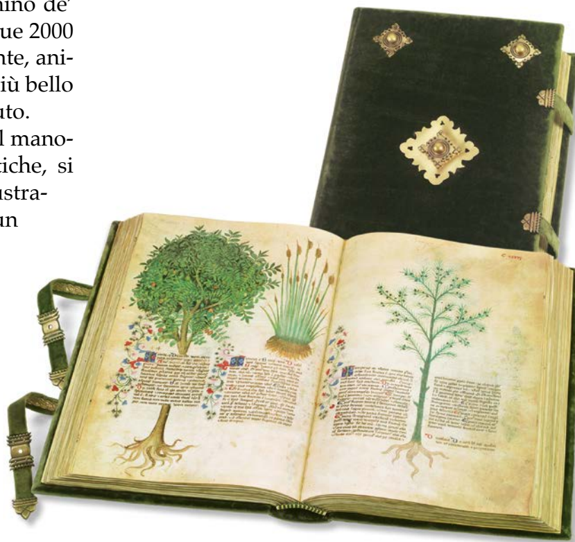
"HISTORIA PLANTARUM" o "TACUINUM SANITATIS" ultimi anni del XIV secolo. Riproduzione in facsimile realizzata nel 2004 come primo esempio di pseudo-enciclopedia medica.

Su richiesta è disponibile un estratto del facsimile dedicato alle pagine su "vino" e "olio".