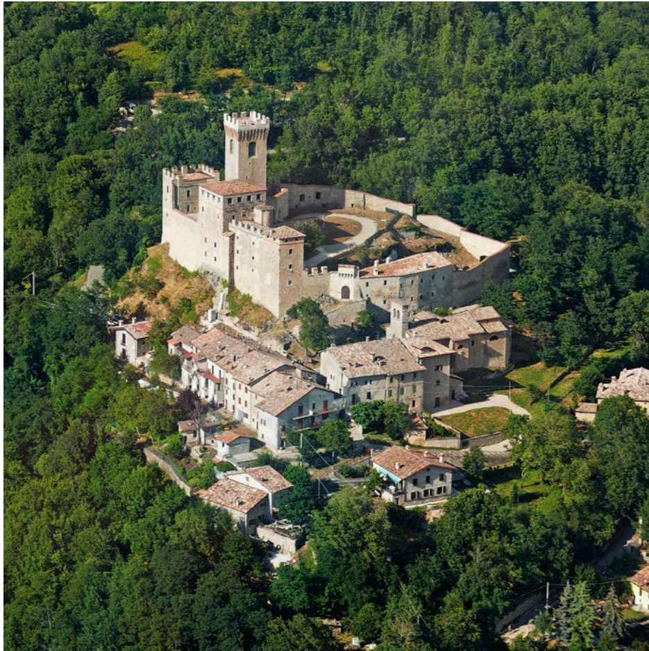
VEDUTA AEREA DEL CASTELLO E DEL BORGO DI MONTECUCCOLO

Tecnicamista è una rivista nata come spazio di confronto. L'idea che la anima è quella di promuovere e sviluppare una discussione su arte, patrimonio culturale e le connessioni possibili tra opere d'ingegno e tutela dei beni immateriali. In questo numero, incentrato sull'opera grafica di Roberto Covili, siamo lieti di ospitare contributi che, nella vocazione della rivista, ci aiutano ad approfondire e dinamizzare l'identità culturale e ambientale del territorio in cui operiamo.