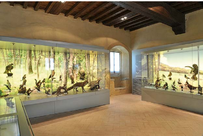
"LA DONAZIONE" DI RAFFAELE BIOLCHINI