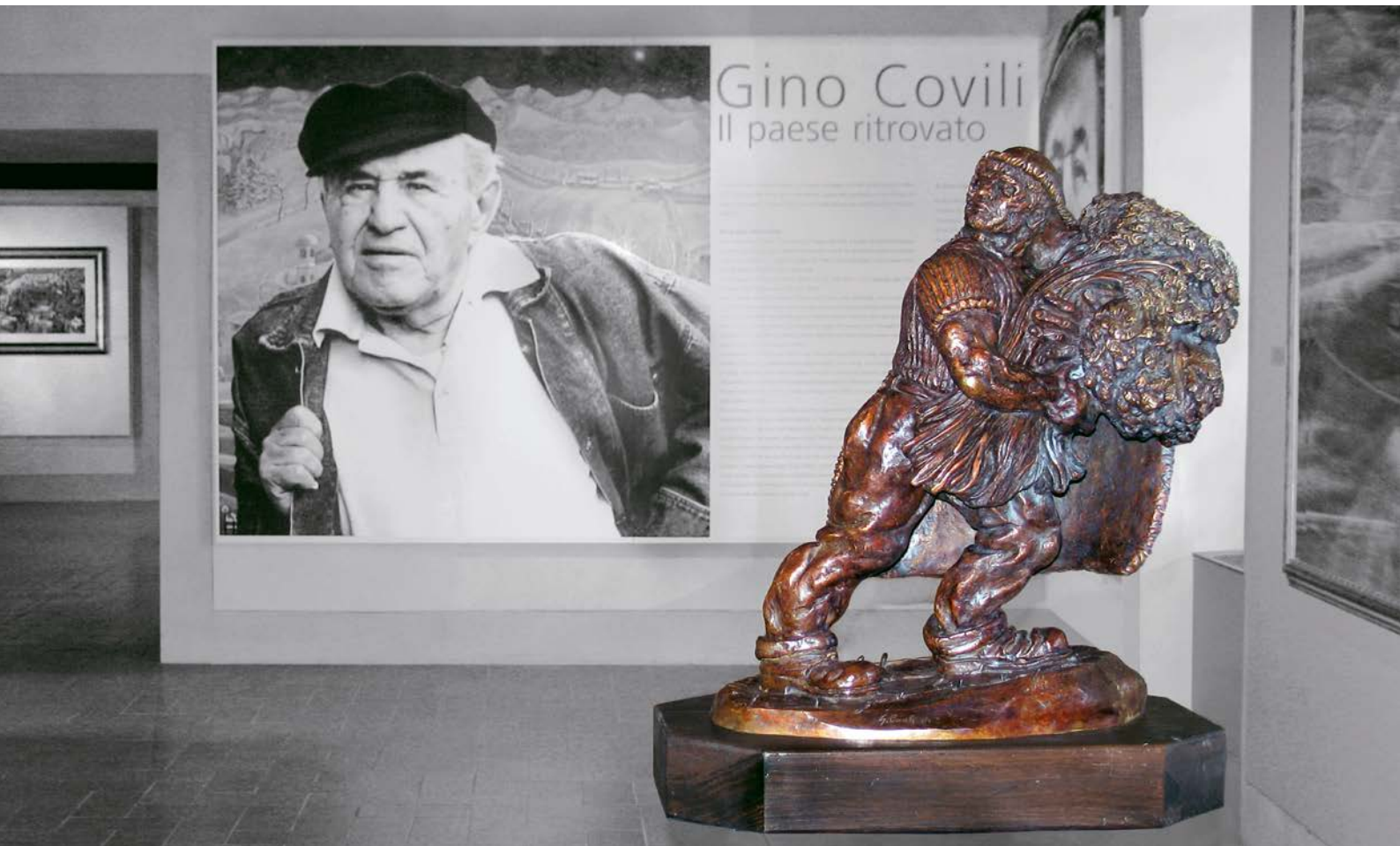
"IL PAESE RITROVATO" DI GINO COVILI